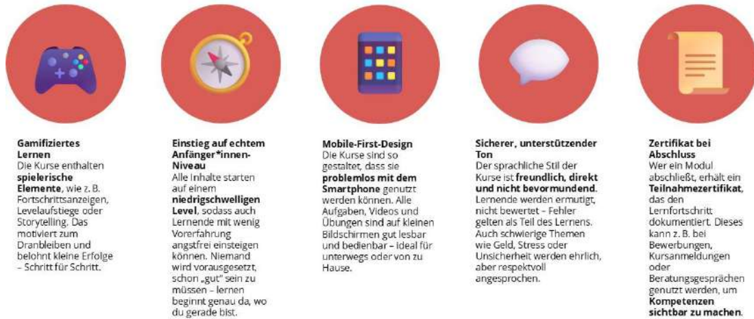
Abbildung 1: Design-Ansprüche des Back on Track Curriulums.